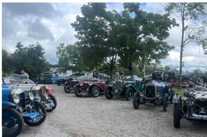
Les SALMSON participantes ... que du beau monde !!!

Tout d'abord une belle photo de ce Rallye récupérée sur FaceBook dans Amilcar et Cyclecars :